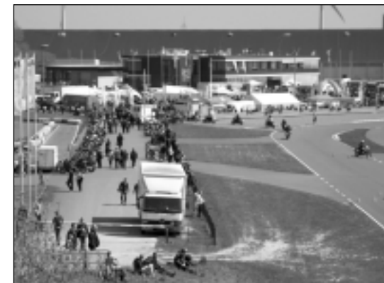
Teil des großen Geländes

Das FSZ Lüneburg ist eines der größten und modernsten seiner Art in Norddeutschland und bietet auf einer Fläche von 21 Hektar zwölf Aktionsmodu-