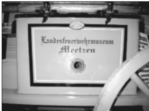
Detail einer Handdruckspritze von 1898

Dabei sind einzelne Themenbereiche in Situationen dargestellt, so dass das Wirken der Feuerwehren anschaulich nachvollzogen werden kann.