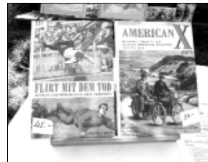
„Flirt mit dem Tod“ – welch ein verheißungsvoller Titel...

Um 14.00 Uhr wird mir die Hitze zu viel. Es sind schon wieder gefühlte 45 Grad im Schatten . Trotzdem ist auch am Sonntag alles entspannt und easy .