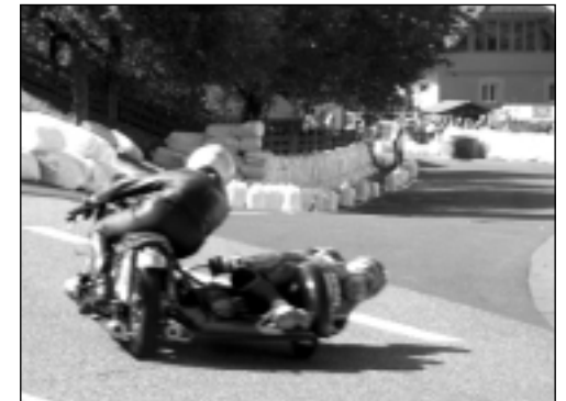
Ich wär' auch mal gern als „Schmiermaxe“ mitgefahren...

Am Montag sind wir weitergefahren nach Geiselhöring in der Nähe von Regensburg, um unser Gespann abzuholen. Dann am Dienstag Weiterfahrt nach Darmstadt zu Freunden.