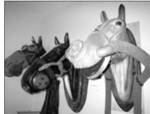
Kein Witz: Es gibt sogar Gasmasken für Pferde

Ein Besuch des Feuerwehrmuseums stand auf dem Programm. Und so trafen sich 13 Clubmitglieder auf acht Motorrädern an der Citti-Tankstelle (natürlich wieder bei schönstem Wetter!), um nach Schwerin zu fahren.