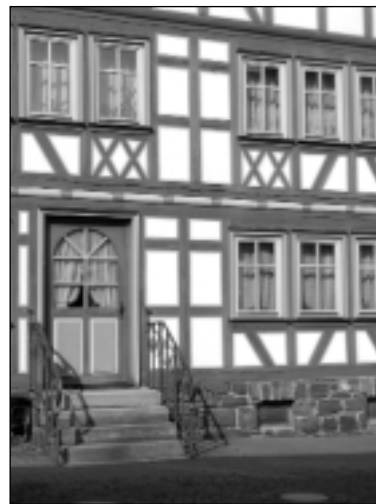
Wir haben in Schotten schöne Fachwerkhäuser gesehen

Gegen halb elf waren wir an der Rennstrecke. Ich fand es toll, dass die einzelnen Klassen nur zwischen zehn und 14 Minuten liefen, so kam keine Langeweile auf.