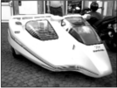
Ein echter Hingucker – das domani-Gespann von Krauser