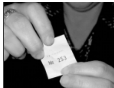
Hurra, wieder ein Gewinn!

Silke konnte Kerze, Teelichter, Autoschondecke und -sitzbezug, Salatbesteck und Luftpumpe mit nach Hause nehmen.